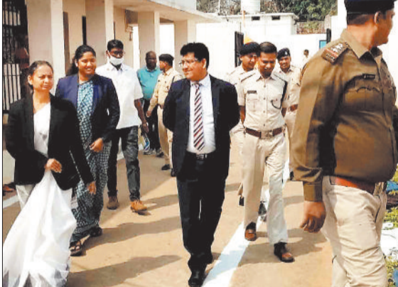
जेल का निरीक्षण करते अधिकारी।