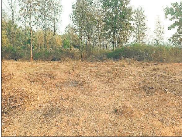
पेड़ों को काटकर बनाया गया मैदान।

वन अमले की लापरवाही से शहर से सटे महामाया पहाड़ के अस्तित्व पर बड़ा संकट उत्पन्न हो गया है। महामाया पहाड़ की सुरक्षा के उद्देश्य से वन विभाग ने पहाड़ी पर अवैध अतिक्रमण करने के साथ ही रेस्ट हाऊस सहित अन्य निर्माण किया है जहां नियमित विभाग के अधिकारी-कर्मचारियों की आवाजाही होती है साथ ही जंगल की सुरक्षा के लिए नियमित कर्मचारी भी नियुक्त हैं लेकिन वन अधिकारियों की लापरवाही से न तो पहाड़ी पर अवैध अतिक्रमण का सिलसिला रूक रहा है न ही सागौन पेड़ों की अवैध कटाई। दुर्भाग्य पहाड़ी के अलग-अलग हिस्से में दिनदहाड़े मरुमूक का उत्खनन कर रहे हैं। धल्ले से चल रहे अवैध कटाई एवं उत्खनन पर लोग वन अधिकारियों पर भी मिलीभगत करने का आरोप