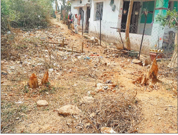
जंगल में कटे सागौन के पेड़।

महामाया पहाड़ पर लगातार बढ़ रहे अवैध अतिक्रमण एवं सागौन पेड़ों की हो रही अवैध कटाई की लगातार शिकायतों के बाद एक बार फिर वन विभाग सक्रिय हो गया है। अतिक्रमणकारियों में मंचा हड़कम्य महा माया पहाड़ी की वन भूमि पर अवैध अतिक्रमण कर रहे 166 लोगों को नोटिस जारी किया है जिससे अतिक्रमणकारियों में हड़कम्य बच गया है।